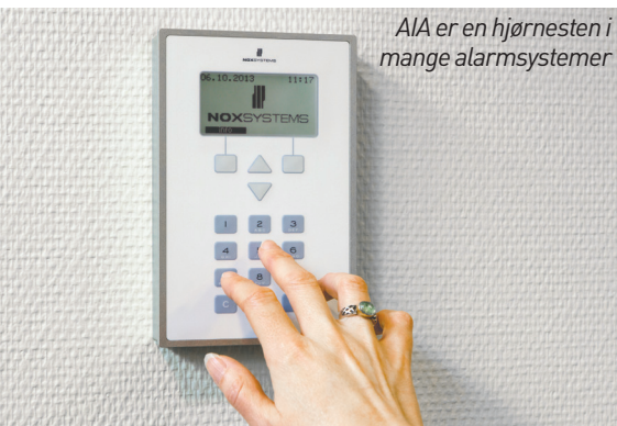
AIA er en hjørnesten i mange alarmsystemer

Er du i tvivl om, hvordan du sikrer dine værdier bedst muligt, kan Strøm Hansen hjælpe dig. Strøm Hansens dygtige alarm- og sikringseksperter tager udgangspunkt i dine aktuelle og præcise behov for alarmer og indbrudssikring. Som en del af en grundig