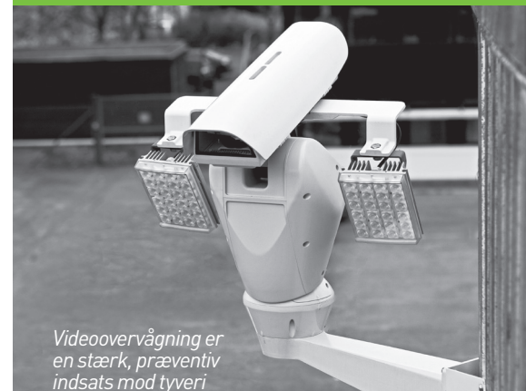
Videoovervågning er en stærk, præventiv indsats mod tyveri

EL-SERVICE • AUTOMATION ENTREPRISE • TRAFIKLEDELSE AIRPORT • ALARMANLÆG SOLCELLER • EL-TAVLER