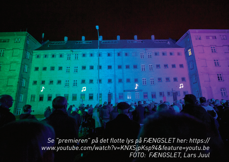
Se "premier" på det flotte lys på FÆNGSLET her: https://www.youtube.com/watch?v=KNXSjpKsp94&feature=youtu.be

"Det tidligere Horsens Statsfængsel lukkede i 2006 efter mere end 150 år med fængselsdrift og åbnede i 2012 som oplevelsesvirksomheden FÆNGSLET". www.faengslet.dk