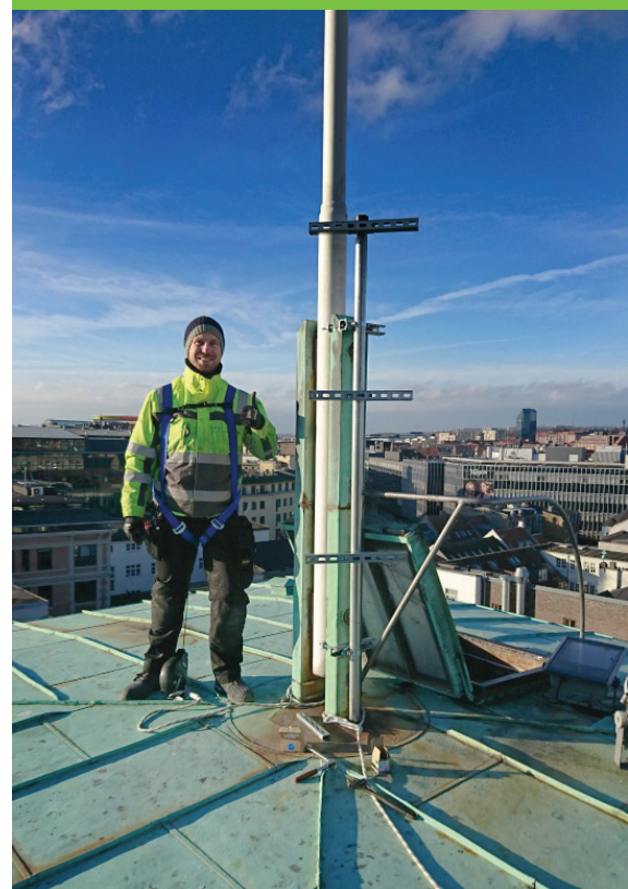
Strøm Hansens folk kommer rundt om det hele. Her er en tapper montør på toppen af Nordeas tårn, hvor en af lyskilderne til det nye lys på kirken skulle placeres.

Strøm Hansen i Nørresundby, Aarhus, Vejle og Glostrup beskæftiger pt. 210 medarbejdere indenfor Automation og Industriel IT; El-Tavler; El-Service; Airport; Trafikledelse; Entreprise, Alarmanlæg og Netværk og IT. Vores udvalgte medarbejdere har hvert deres speciale, og udgør i fællesskab et stærkt og fagligt begavet team, som sikrer vores kunder den mest optimale løsning til den bedste pris.