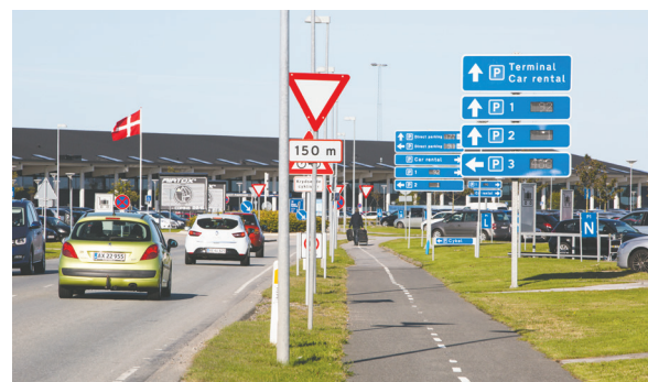
Tællestationerne og de intelligente P-infoskilte er egenproducerede hos Strøm Hansen