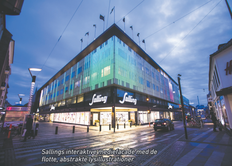
Sallings interaktive mediefacade med de flotte, abstrakte lysillustrationer

Salling har været kendt for kvalitet og gode oplevelser, siden Ferdinand Salling i 1906 åbnede en manufakturhandel i Søndergade i Aarhus. I 1915, og i årene fremover, opkøbte F. Salling flere ejendomme, og i slutningen af 40'erne blev drømmen om et stormagasin realiseret.